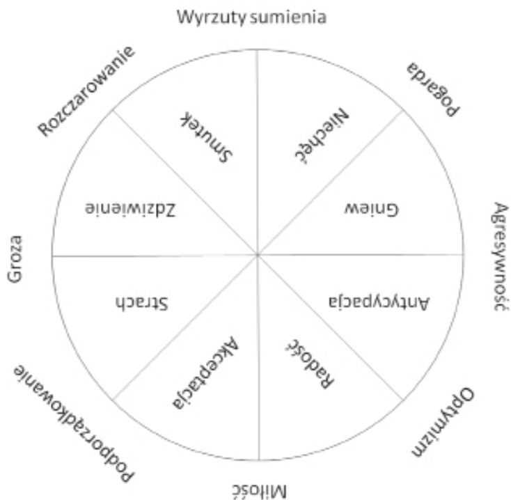
Rysunek 1. Koło emocji wg Roberta Plutchika