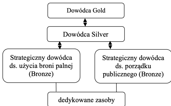
Schemat 2. Schemat struktury dowodzenia GSB